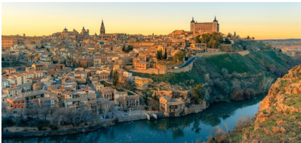
Bilde av Toledo: Adobe Stock

Den spanske inkvisisjonen lyktes i første omgang med å slå ned reformasjonens inntog i Spania. Først på 1800-tallet kom misjonærene fra evangeliske kirkesamfunn til Spania. Men ingen luthersk kirke eksisterte for spansktalende. Javier leste mye litteratur på engelsk fra reformatorene. Han nærmet seg femti år da han i brevs form henvendte seg til den lutherske kirke i Frankrike med spørsmål om de kunne sende misjonærer til Spania for å etablere en luthersk kirke. Derfra